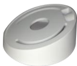
DS-1259ZJ Потолочное крепление