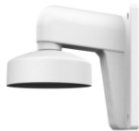
DS-1273ZJ-130-TRL Настенный кронштейн